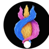
Figura 04 Chama Trina nascida da Chama Branca 4