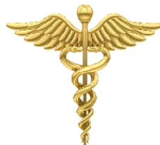
Figura 03 Caduceu de Mercúrio 3

EU SOU O QUE EU SOU EU SOU O CORPO FÍSICO EU SOU O CORPO VITAL (ou Etérico) EU SOU O CORPO ASTRAL (ou dos Desejos) EU SOU O CORPO MENTAL EU SOU O CORPO CAUSAL (da Vontade) EU SOU O CORPO ESPIRITUAL (da Consciência) EU SOU O CORPO DO ÍNTIMO EU SOU O QUE EU SOU