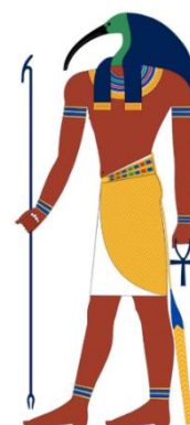
Figura 05 Thoth